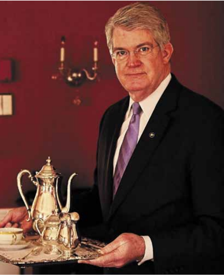
Šiuolaikinis vyresnysis liokajus amerikietis.