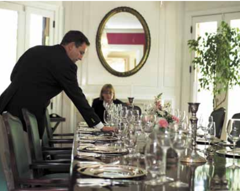
Viena iš nelengvų mokymo užduočių – pagal visas taisykles paservuoti stalą.