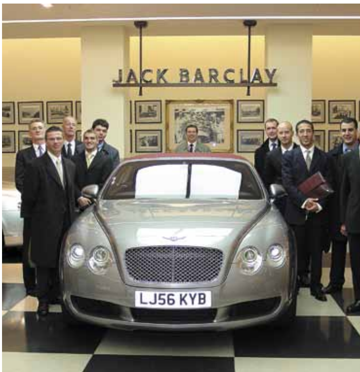
Viena iš praktinių užduočių – išrinkti šeiminkui naują automobilį.

Duris į prabangaus Meiferio rajone esančius namus vyresniajam liokajui iš Lietuvos atvėrė Londone esančios prestižinės tarptautinės liokajų mokyklos „Ivor Spencer Butler School“ išsilavinimas ir diplomas. Angliškas terminas butler (liet. – „vyresnysis liokajus“) yra kilęs iš prancūzų kalbos žodžio bouteillier . Pažodžiui jis reiškia puodelio nešėją arba asmenį, atsakingą už butelius.